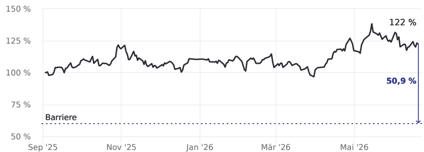
Abstand zur Barriere