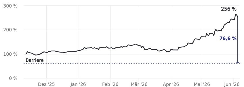
Abstand zur Barriere