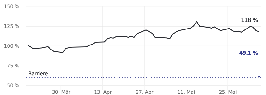
Abstand zur Barriere