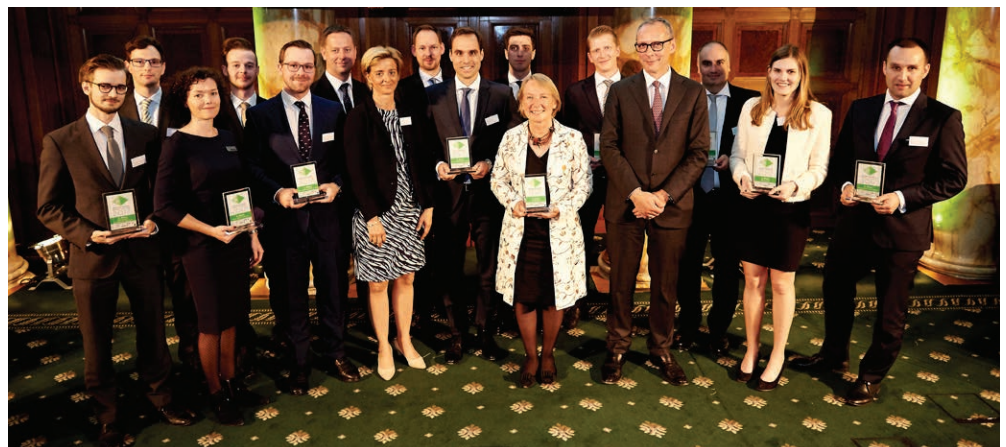
Unangefochten zum neuerlichen Gesamtsieg: das erfolgreiche Zertifikate-Team der RCB

Im Oktogon der Bank Austria in der Wiener Innenstadt wurden die Auszeichnungen feierlich verliehen. Gastgeber war das Zertifikate Forum Austria (ZFA) mit seinem Partner ZertifikateJournal. Die unabhängige und hochkarätige Fachjury, bestehend aus 21 Branchen-Experten, hat entschieden: Mit nur einer Ausnahme (Platz 2 in der Kategorie Hebelprodukte) setzte sich die Raiffeisen Centrobank (RCB) in allen Kategorien als Sieger durch.