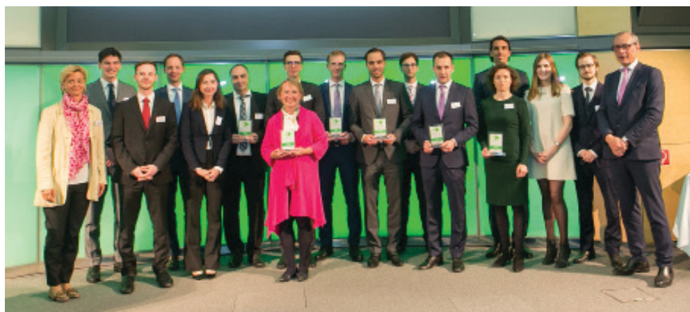
Das erfolgreiche Zertifikate-Team der RCB

Im Raiffeisensaal der Raiffeisen Bank International wurden die Auszeichnungen feierlich verliehen. Gastgeber war das Zertifikate Forum Austria (ZFA) mit seinem Partner ZertifikateJournal. Die unabhängige und hochkarätige Fachjury, bestehend aus 21 Branchen-Experten, hat entschieden: Mit nur einer Ausnahme (Platz 4 in der Kategorie Hebelprodukte) setzte sich die Raiffeisen Centrobank (RCB) in allen Kategorien als Sieger durch.