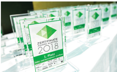
Die Zertifikate Awards Austria 2018