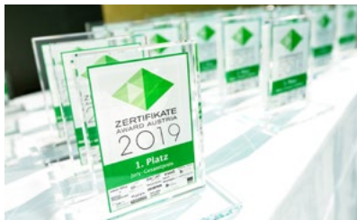
Die Zertifikate Awards Austria 2019