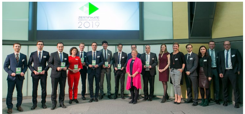
Das erfolgreiche Zertifikate-Team der RCB

Im Raiffeisensaal der Raiffeisen Bank International in Wien wurden die Auszeichnungen feierlich verliehen. Gastgeber war das Zertifikate Forum Austria (ZFA) mit seinem Partner ZertifikateJournal. Die unabhängige und hochkarätige Fachjury, bestehend aus 22 Branchen-Experten, hat entschieden: Die Raiffeisen Centrobank (RCB) setzte sich zum 13. Mal in Folge als Sieger durch.