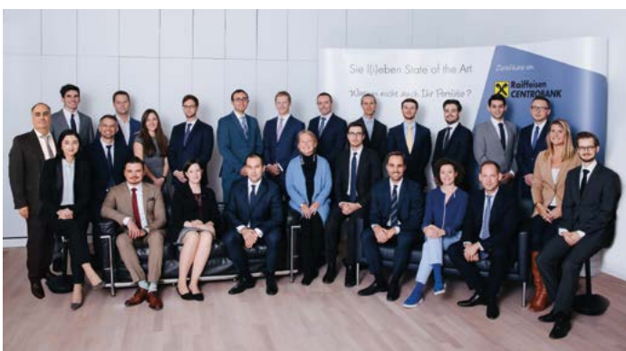
Das erfolgreiche Team „Strukturierte Produkte“ der Raiffeisen Centrobank