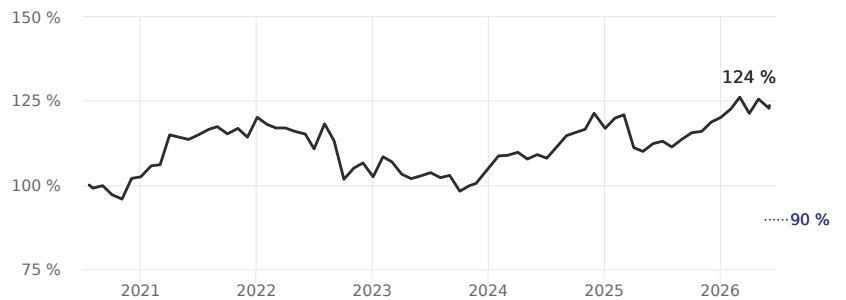
Erfahren Sie mehr über diese Grafiken

Bitte beachten Sie, dass die Wertentwicklung der Vergangenheit keine verlässlichen Rückschlüsse auf die zukünftige Wertentwicklung zulässt.