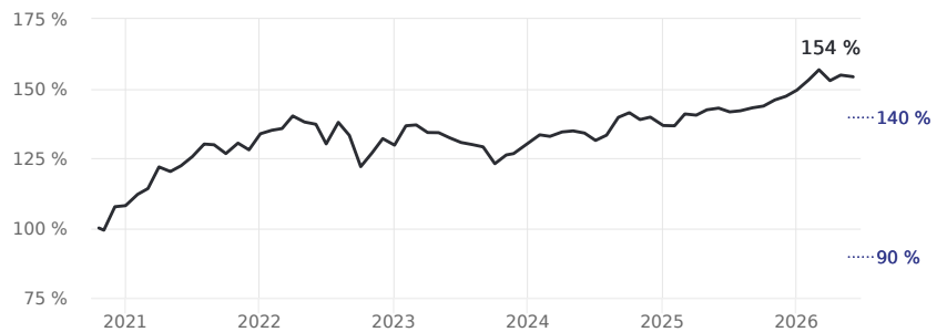
Erfahren Sie mehr über diese Grafiken

Bitte beachten Sie, dass die Wertentwicklung der Vergangenheit keine verlässlichen Rückschlüsse auf die zukünftige Wertentwicklung zulässt.