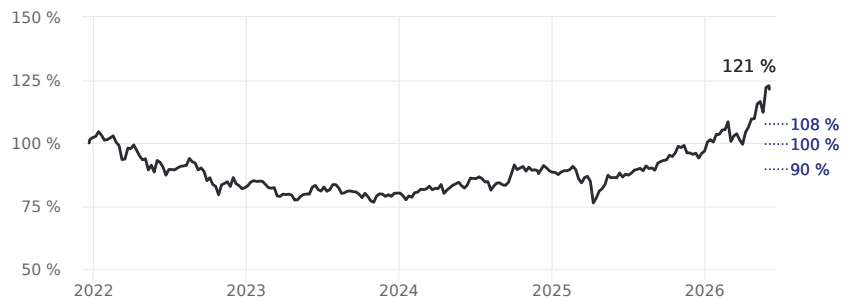
Erfahren Sie mehr über diese Grafiken

Bitte beachten Sie, dass die Wertentwicklung der Vergangenheit keine verlässlichen Rückschlüsse auf die zukünftige Wertentwicklung zulässt. Seit Auflage dieses Zertifikats sind noch keine fünf Jahre verstrichen.