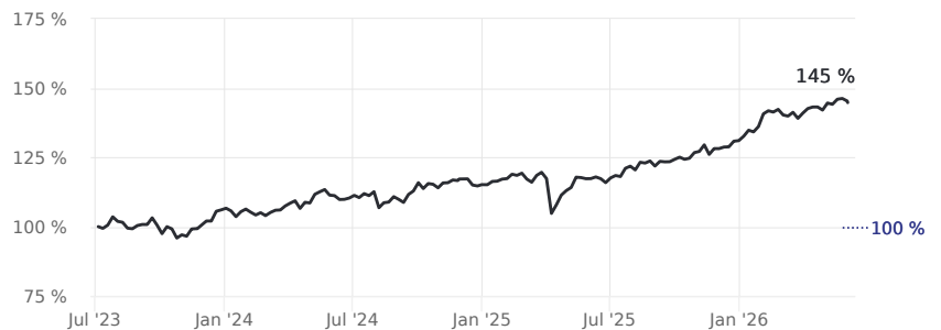
Erfahren Sie mehr über diese Grafiken

Bitte beachten Sie, dass die Wertentwicklung der Vergangenheit keine verlässlichen Rückschlüsse auf die zukünftige Wertentwicklung zulässt. Seit Auflage dieses Zertifikats sind noch keine fünf Jahre verstrichen.