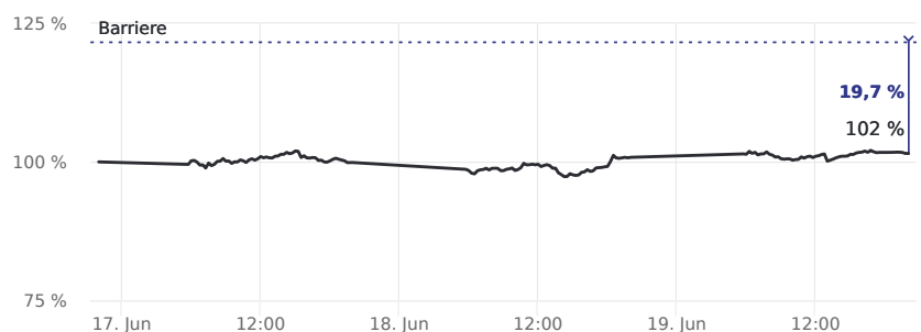
Abstand zur Barriere