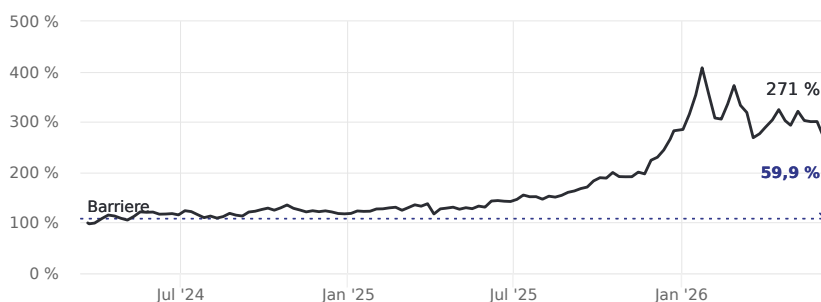
Abstand zur Barriere