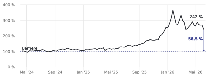
Abstand zur Barriere