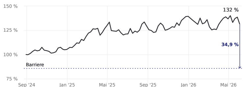
Abstand zur Barriere