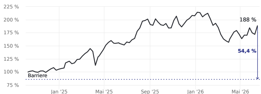
Abstand zur Barriere