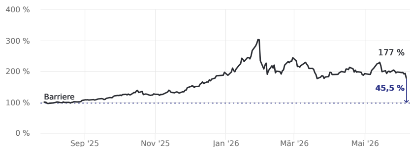
Abstand zur Barriere